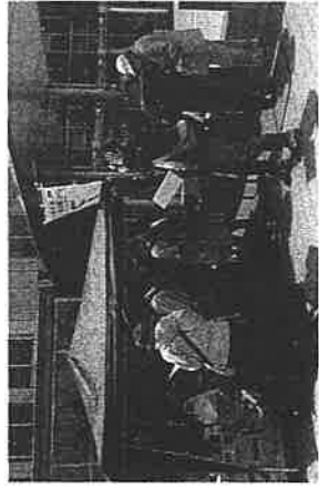
フードバンクを利用する市民

日本共産党は、「これまでの委託化は『新しい経営』の名目で、直営が小金井らしい給食の質を守る役割を果たしている。なぜ委託なのか説明もなく全校委託化は許されない」、「誰のための給食なのかをよく考えなければならぬ」など意見を述べました。